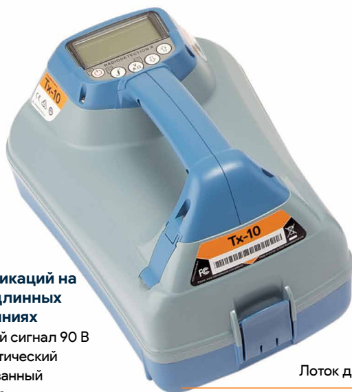
Лоток для аксессуаров

Подберите свой генератор к модели локатора для простоты настройки и использования